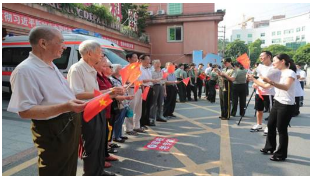
原军校老专家教授参加快闪活动