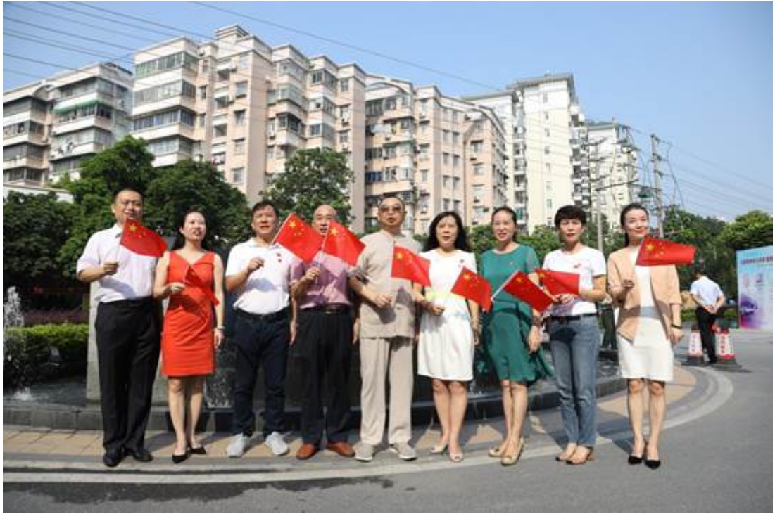
曾荣立集体二等功、被广州军区授予“模范学员队”、 全国“军民共建社会主义精神文明先进单位”的模范学员队代 表 参加快闪活动