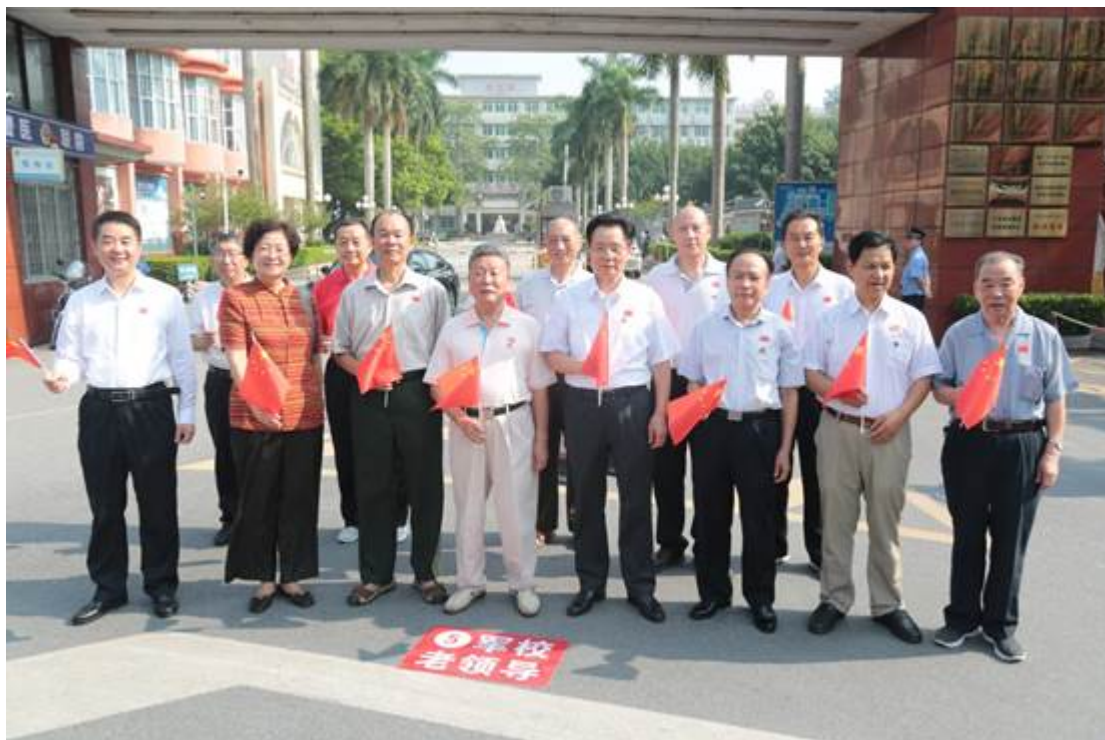
原军校历届领导参加快闪活动