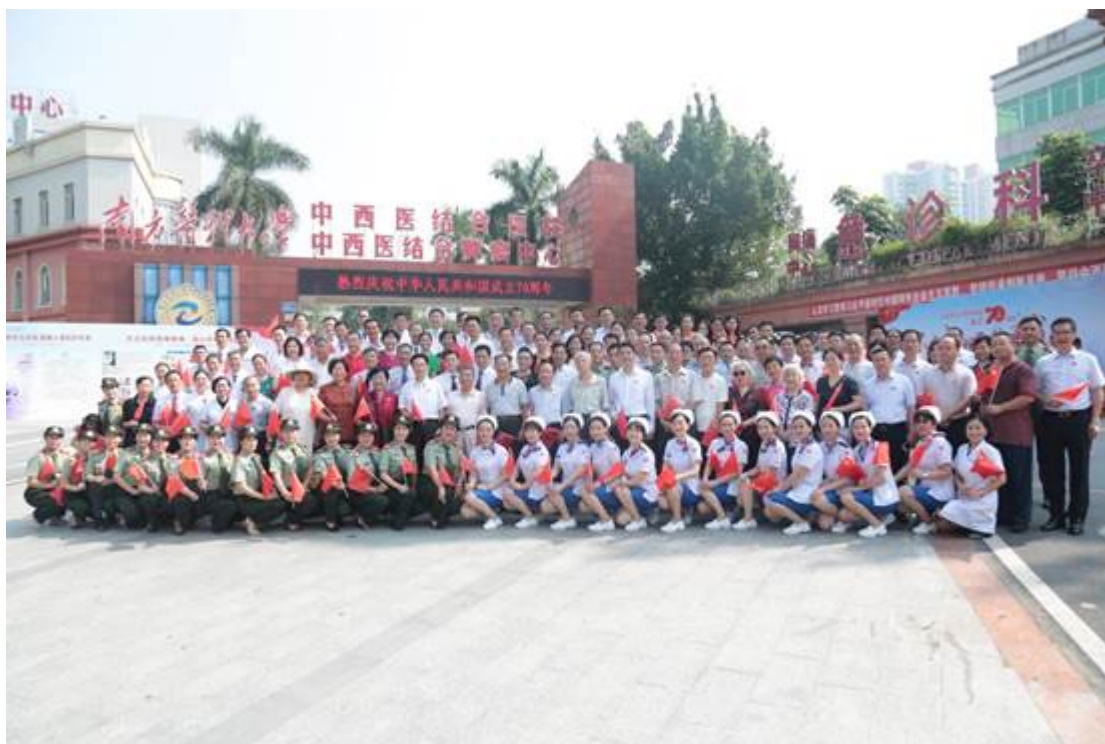
参加快闪活动人员大合影

上午8时许，原军校历任领导、校友、我院党委班子、医护代表等人齐聚一堂，在医院门口广场参加“我和我的祖国”快闪活动。军校历届校首长代表、专家教授代表、获得全国、全军等高等荣誉的杰出校友代表、模范学员队和女子军乐队代表，还有