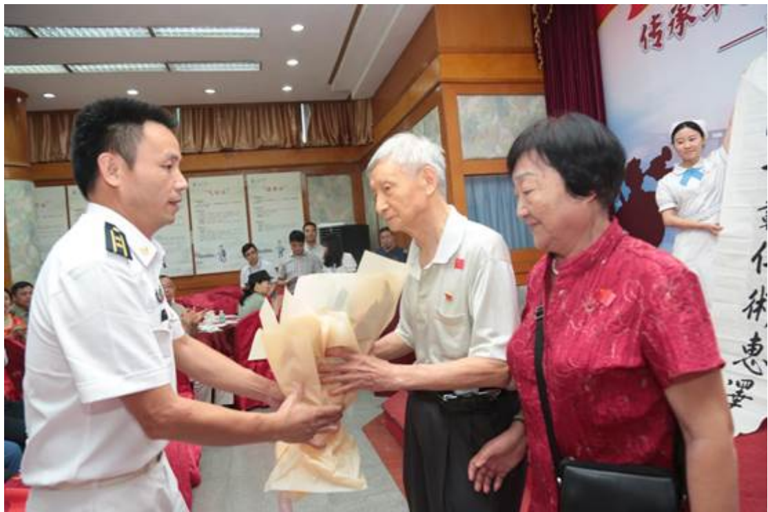
原军校各届学员代表向老前辈献花