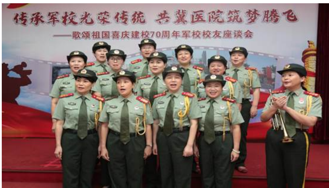
女子军乐队首届队员领唱军歌《我是一个兵》

在座谈会现场，校友们用不同的方式表达了对军校生活的怀念，对母校的美好祝愿。原广州军区政治部副主任、原医高