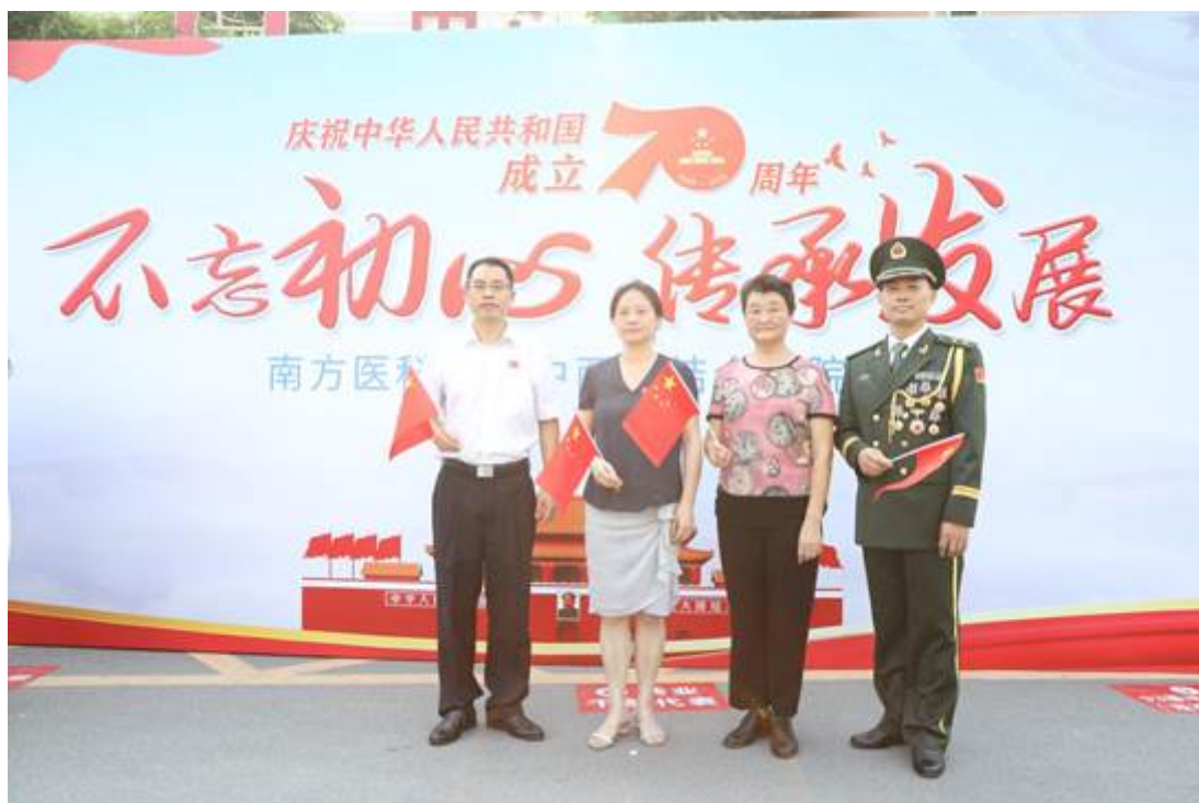
参加快闪的杰出校友