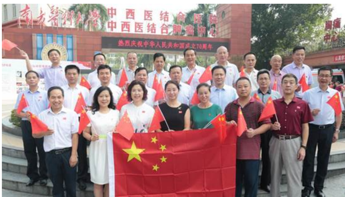
原军校校友代表参加快闪活动