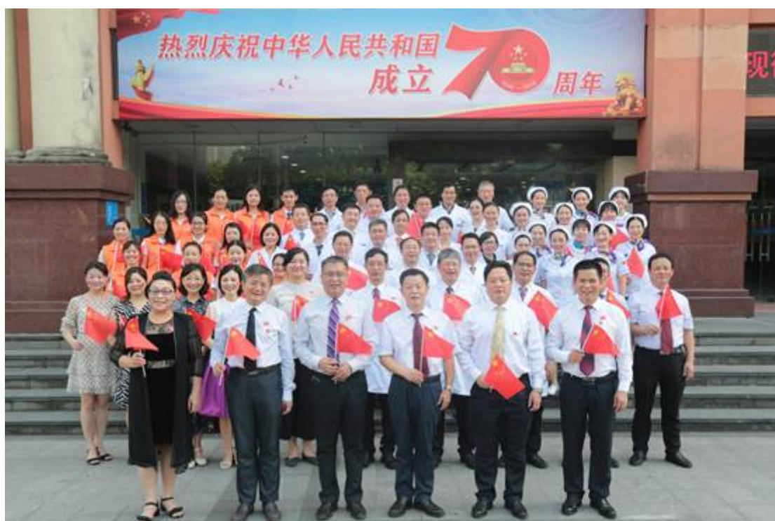
医院领导和管理团队、医生、护士、志愿者代表参加快闪活动